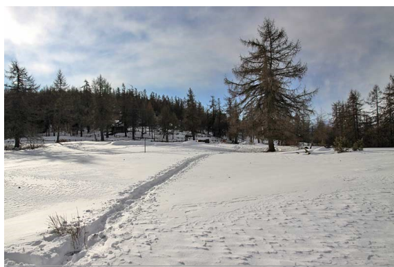
Col Tzécure—1.607 m

Percorso: iniziamo l'escursione dal piccolo parcheggio di fronte all'area picnic, al Col Tzécure (1.607 m), affrontando la dolce salita lungo il grande pascolo, adiacente al parcheggio, fino allo steccato che lo delimita; si procede poi prima in piano, poi leggermente in salita, puntando leggermente alla sinistra dell'alpeggio; da questo punto si inizia a guadagnare quota, il sentiero (si sta di fatto ricalcando abbastanza fedelmente quello che è il sentiero estivo n. 5) entra nel bosco, risalendo dolcemente il pendio.